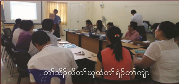
တၢ်သိၣ်လိတၢ်ဃုထံတၢ်ရဲၣ်တၢ်ကျဲၤ

၂. ဒ်သီးနံနဲကယာ(၂၁)မံးရှုာ်တၢ်တိာ်ကျဲၤခံပတီၢ်တပတီၢ်တၢ်ပညိာ် တၢ်ကွၢ်စိကလာပဲၤအဂီၢ်, ပအိၣ်ဒီး တၢ်သးကျဲၤကတၢ်ကတီၤကၤကရၢ်အတၢ်ဟံၣ်ဖိာ်မၤသကိး လၢအမ့ၢ် ကရၢ်(၁) တၢ်ဃုထံတၢ်ရဲၣ်တၢ်ကျဲၤ ဒီး ကရၢ်(၅)တၢ်ထုးထီၣ်လံာ်လံာ်ဒီး တၢ်ဒုးအိၣ်ထီၣ်လံာ်ရဲၣ်ဖိာ် တၢ်ရဲၣ်တၢ်ကျဲၤန့ၣ်လီၤ.