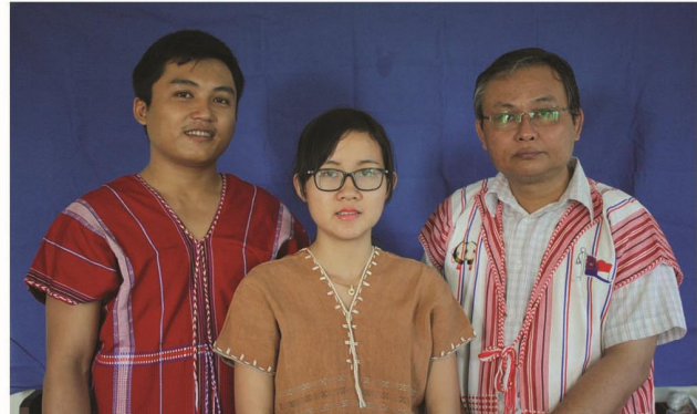
ဝဲၤကျိၤပုၤမၤသကိးတၢ်တဖၣ်

ဒ်ခခါဆၢကတီၢ် တၢ်လဲၤထီၣ်လဲၤထီၣ်အိၣ်ဝဲအသိး လၢတၢ်မၤသကိး ခရဲၣ်တၢ်သးခုကစီၣ်ကိးကပၤဒဲးအတၢ်ဘၣ်ထွဲတုၤအိၣ်လိာ်သး ကဂုၤထီၣ်အဂီၢ် ပုၤကညီၤဘျၢထံခဝုရှုာ် သးကျဲၤဒုးအိၣ်ထီၣ် တၢ်ဘၣ်ထွဲတုၤအိၣ်လိာ်သး ကမံးတံၣ်ဖဲ(၁၉၉၉)န့ၣ် လၢခဝုရှုာ်ပၤဆၢတၢ်ကမံးတံၣ် ခီဖျိကမံးတံၣ်မၤတၢ် ဒီးတၢ်အၢၣ်လီၤတူၢ်လိာ်အိၣ်လဲၤလၢပၤဆၢတၢ်ကမံးတံၣ်ခီဖျိ တၢ်စံၣ်ညီၣ်အၢၣ်လီၤ နီၣ်ဂံၢ် (ပဆု- ၉၉.၆၂၂)ဒီး ဘၣ်တၢ်ပၢ်ဂၢ်ပၢ်ကျၢၤအိၣ်ဖိာ်ဖိ (၈၂)ဘျီတဘျီ (က. ၉၉.၆၈)န့ၣ်လီၤ. ဖဲ(၂၀၀၅)န့ၣ်, ဘၣ်တၢ်ဒုးအိၣ်ထီၣ်အိၣ်ဒီး တၢ်ဘၣ်ထွဲတုၤအိၣ်လိာ်သးဝဲၤကျိၤအသိးန့ၣ်လီၤ. ခဲအံၤဝဲၤကျိၤပုၤမၤသကိးတၢ်တဖၣ် မ့ၢ်ဝဲၤသရဲၣ်ဒိၣ်မူဖျါထူ, သရဲၣ်မုၢ်ဂုၤဂုၤထူ, သရဲၣ်ကွဲးစၢၣ်န့ၣ်လီၤ.