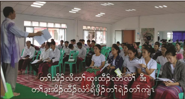
တၢ်သိၣ်လိတၢ်ထုးထီၣ်လံာ်လံာ် ဒီး တၢ်ဒုးအိၣ်ထီၣ်လံာ်ရဲၣ်ဖိာ်တၢ်ရဲၣ်တၢ်ကျဲၤ